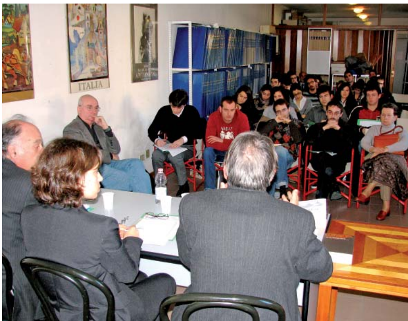
La Biblioteca dell'Istituto di Storia moderna durante una fase dei lavori