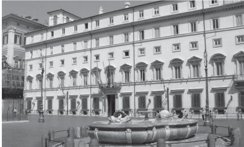
Palazzo Chigi, sede del Governo

Ciò di cui non c'è ancora grande consapevolezza è che, se la crisi è mondiale, la politica nazionale è, per definizione, spiazzata ed incapace di affrontare i nodi reali del problema. Questa è la contraddizione principale di fronte alla quale la politica si trova. Al contrario essa continua a riprodurre i meccanismi del 'gioco nazionale', relegando i problemi dell'ordine europeo ed internazionale ad un ambito che viene presentato come lontano, sganciato dalla lotta politica presentata come reale. Ma così facendo si