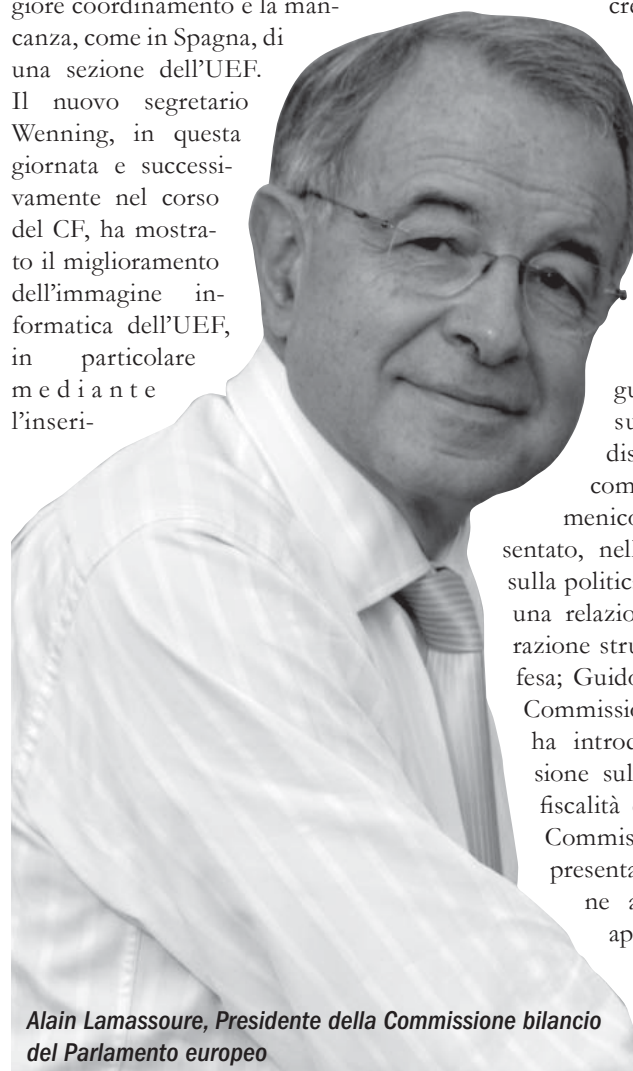
Alain Lamassoure, Presidente della Commissione bilancio del Parlamento europeo