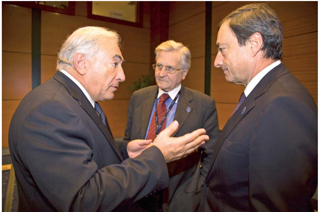
Il Direttore del FMI Strauss-Kahn, il Presidente della BCE Trichet ed il Governatore della Banca d'Italia Draghi

Con il "Fondo Europeo di Stabilità Finanziaria" varato dai paesi dell'euro nel momento più acuto della crisi greca si sono poste le basi per un'azione europea sul debito pubblico. Il Fondo ha enormi limiti, molto simili a quelli previsti dagli accordi istitutivi del Sistema Mone-