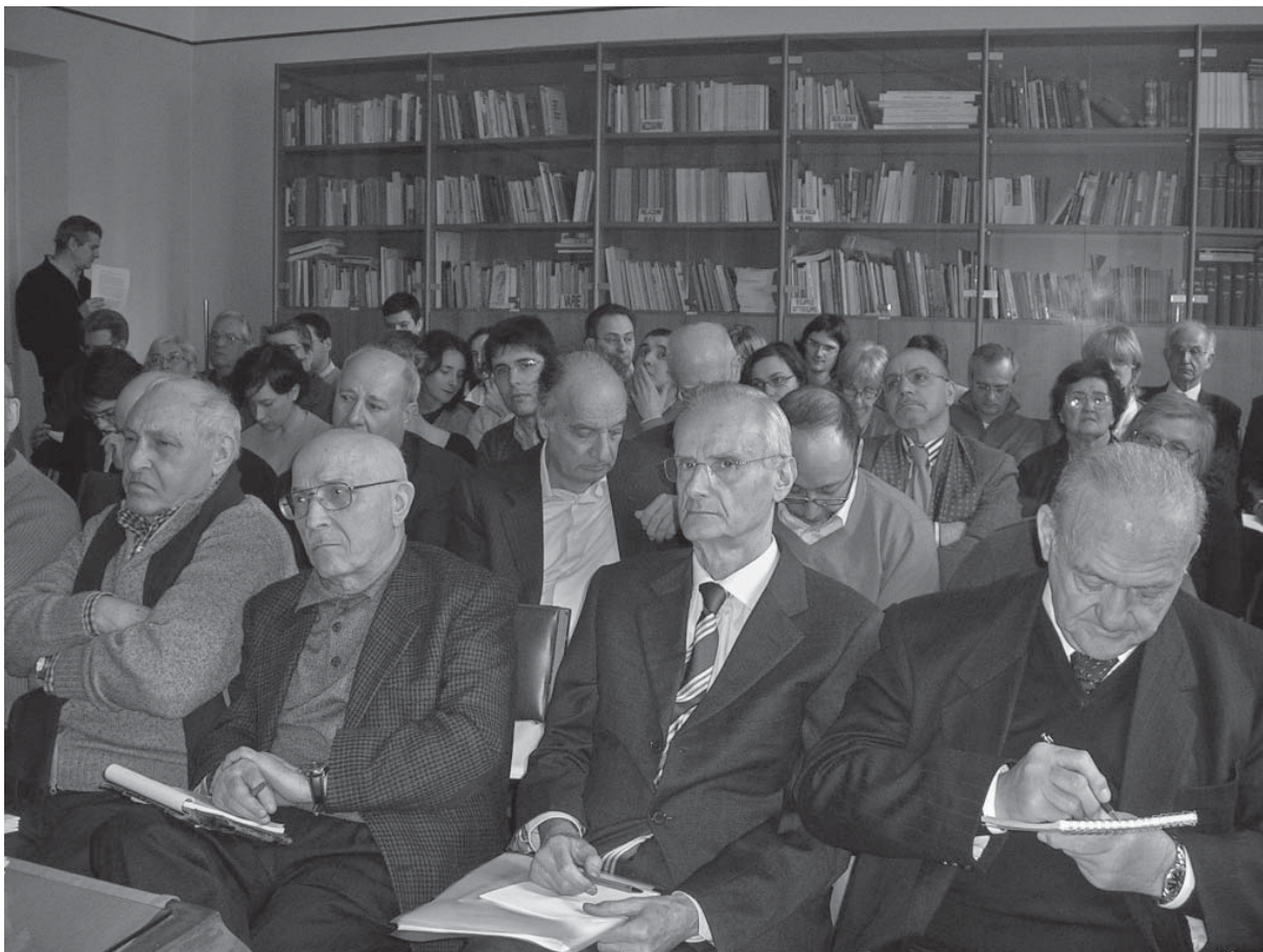
Una riunione del Comitato centrale nella sede del CIFE a Roma