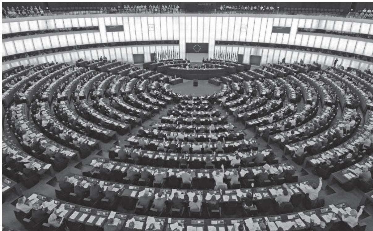
Una seduta plenaria del Parlamento europeo

Questo avvistamento tra i due piani, da un lato le iniziative per promuovere l'occupazione (anche “di qualità”) e dall'altro la salvaguardia della dignità