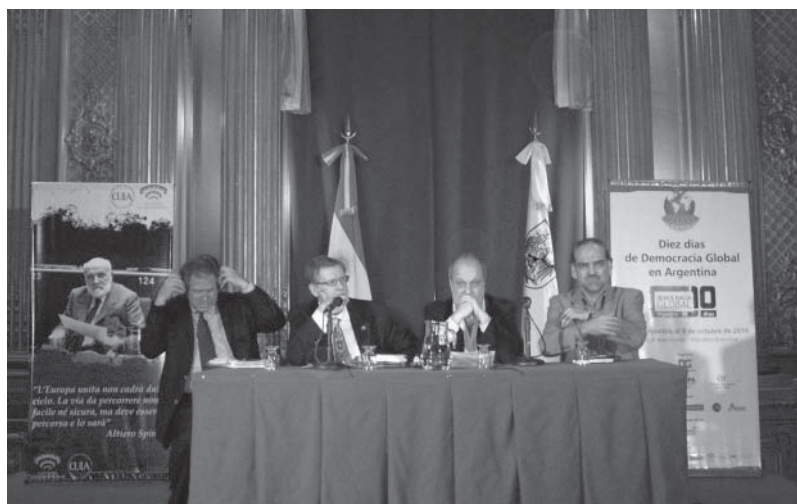
Il tavolo della presidenza durante i lavori del Council del WFM nel Senato argentino

L'Unione europea è un modello da seguire. È un processo di trasformazione di quello che all'inizio era un'organizzazione internazionale. Ora ha un Parlamento, una Commissione esecutiva, una Corte di