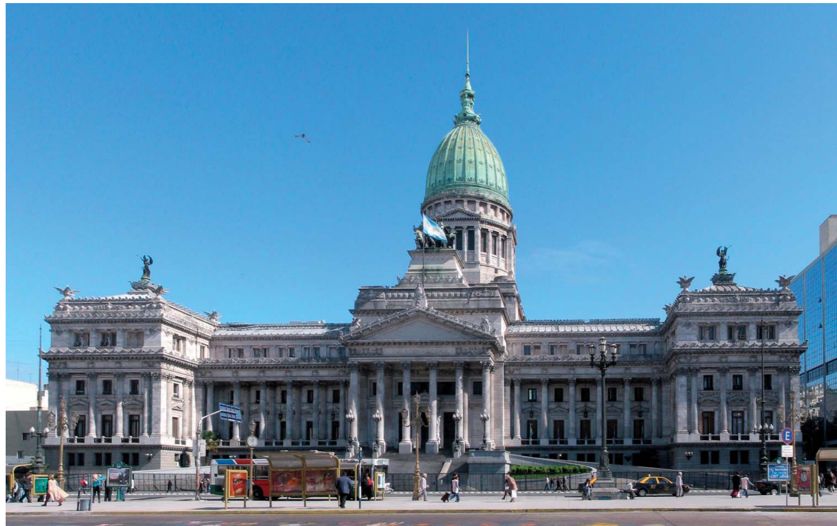
L'imponente sede del Parlamento argentino

Il futuro è arrivato velocemente. Con i tempi che corrono la democrazia è fortemente minacciata in Argentina,