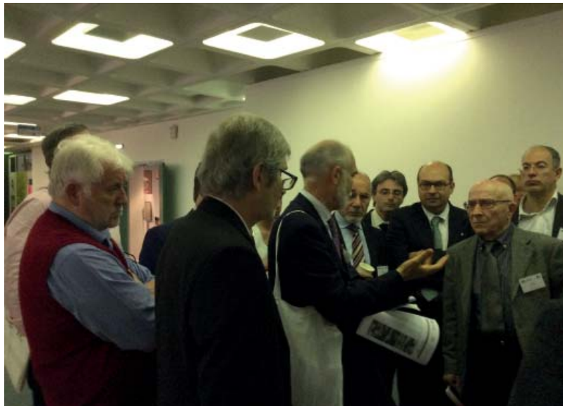
Riunione della delegazione italiana durante la pausa congressuale