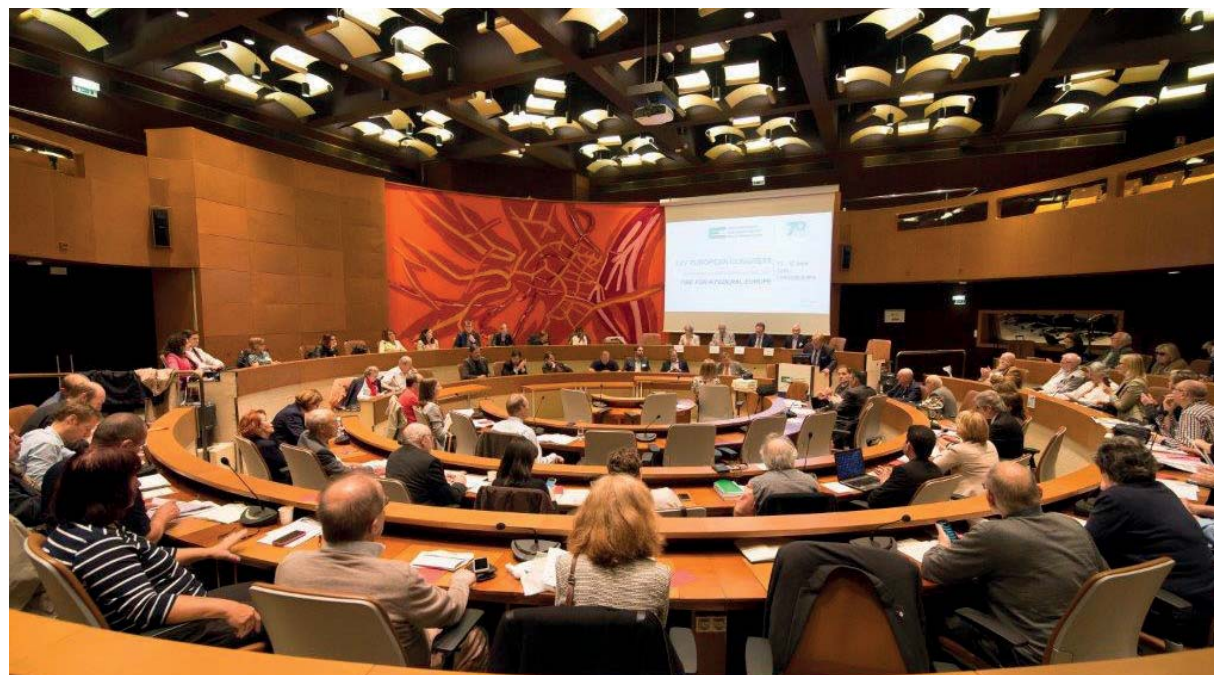
La plenaria del Congresso nella sala municipale di Strasburgo

ducia reciproca e sulla solidarietà fra gli Stati membri. Occorre creare un quadro legale per la politica sulla migrazione, anche in grado di distribuire equamente il peso di tale politica, tenendo conto sia delle nuove vie e delle nuove tendenze della mobilità umana, sia delle sfide demografiche e produttive. In questa prospettiva, bisognerebbe introdurre un'ambiziosa politica di integrazione a livello europeo per rispondere alle sfide generate dalle diversità etniche, religiose e culturali che le società europee si trovano a fronteggiare e per impedire tutte le forme di razzismo e di xenofobia.