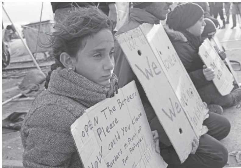
L'accoglienza comporta una politica europea efficace per l'Africa

Il piano della Commissione prevede di mobilitare 8 miliardi di euro nei prossimi cinque anni e, successivamente, di attivarne altri 31 sulla base di 3,1 miliardi messi a disposizione dall'UE, aumentabili ad ulteriori 31, se gli Stati membri metteranno a disposizione la stessa cifra dell'UE. In teoria, si potrebbe quindi arrivare a 70 miliardi di euro. Si può pertanto cominciare a darne una valutazione dal punto di vista politico e dal punto di vista economico. Dal punto di vista politico, siccome i paesi africani interessati sono fortemente instabili, sarà necessario che l'intervento economico sia accompagnato da una politica di sicurezza congiunta Unione europea - Unione africana, rafforzando e sfruttan-