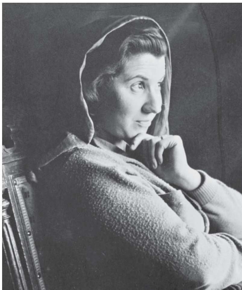
Etty Hillesum (15 gennaio 1914 - 30 novembre 1943)