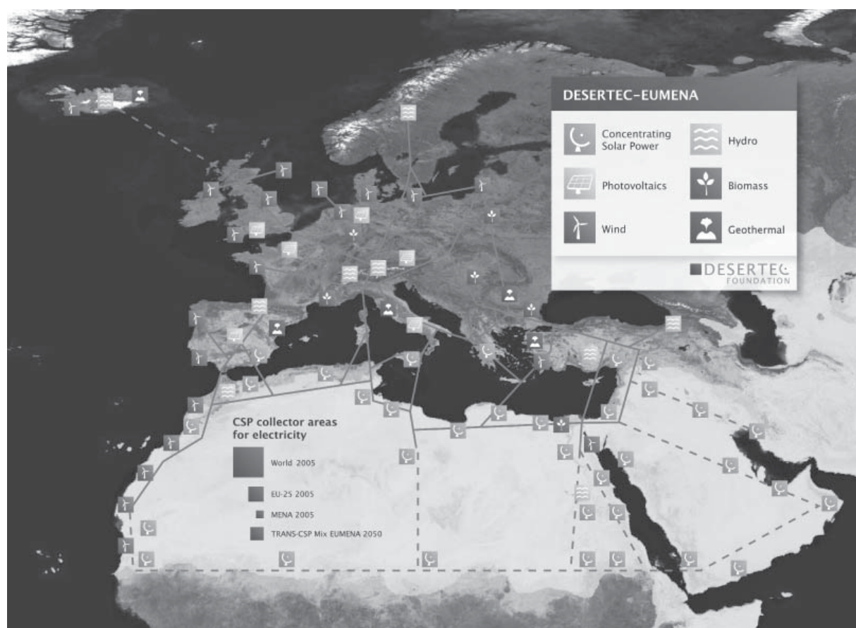
Mapa della struttura di rete del progetto Desertec.