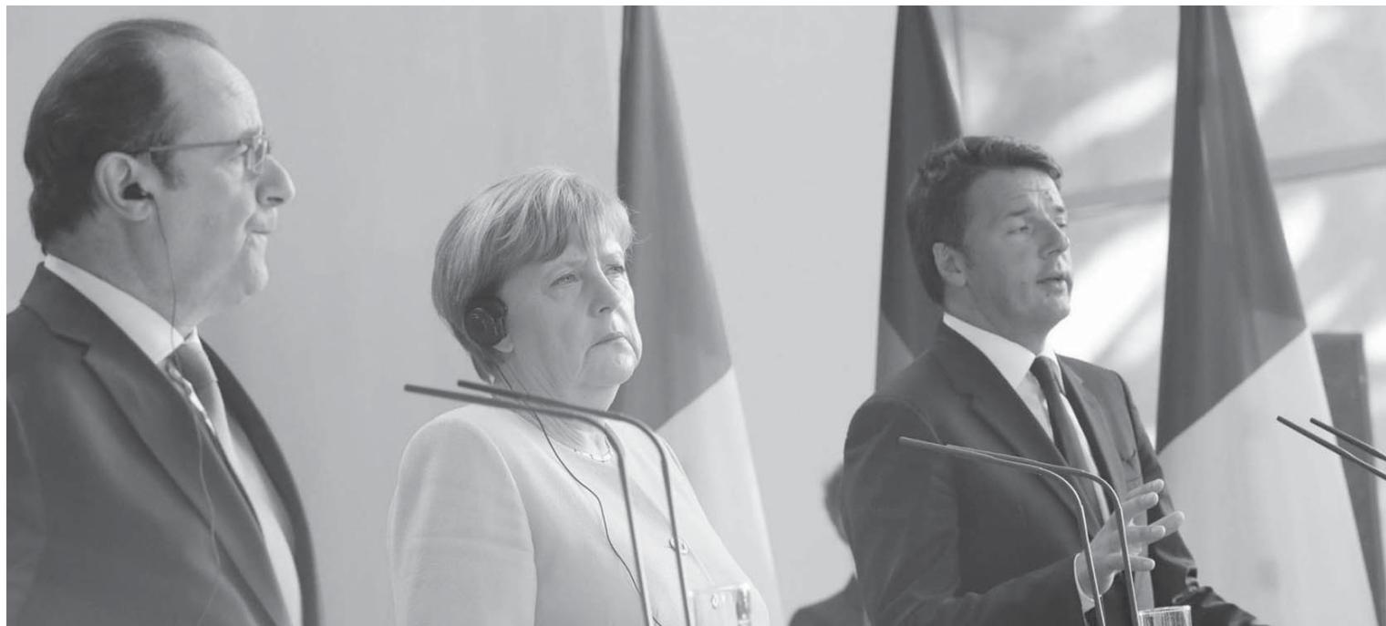
Hollande, Merkel, Renzi: con Brexit il tempo degli alibi è finito

La riprova del fallimento di tale approccio miope sta nei fatti. La strategia dell'Unione europea adottata negli anni della crisi non ha dato i frutti sperati. L'obiettivo del rigore nei bilanci nazionali – che è giusto, in ciò la posizione del governo tedesco è corretta – si è rivelato non sufficiente alla ripresa dell'economia e comunque è stato applicato in modo errato e addirittura controproducente in questa fase di crisi dell'economia. La crescita dell'Europa rimane troppo bassa e la disoccupazione, soprattutto giovanile, è intollerabilmente alta: il confronto con gli Stati