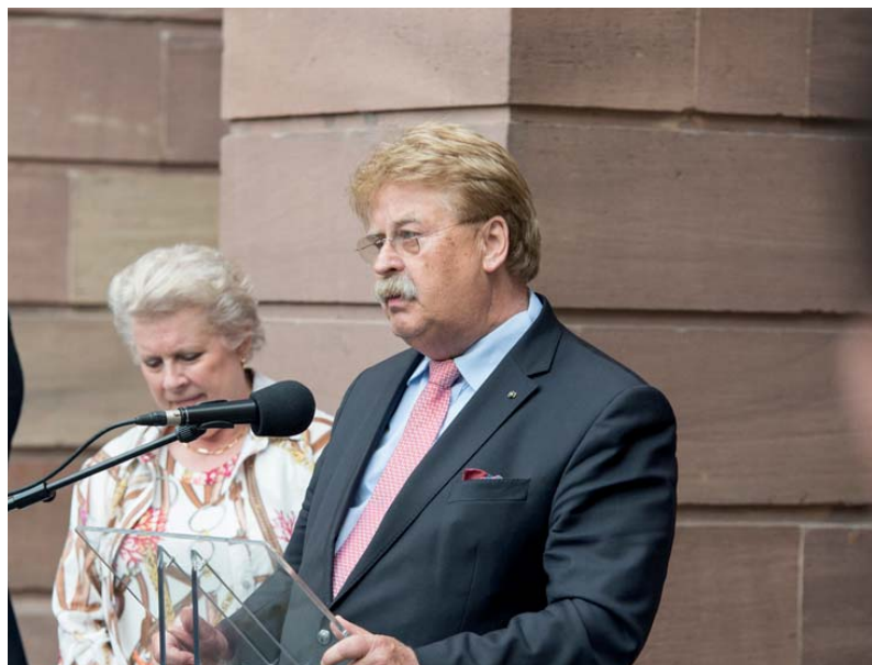
Elmar Brok, presidente UEF, e Catherine Trautmann, vice-presidente dell'Eurométropole di Strasburgo

Anche i lavori delle commissioni politiche, che si sono tenute nella mattinata di sabato, sono state occasioni importanti di dibattito, e anche di confronto con esperti esterni che hanno contribuito ad approfondire temi cruciali. La prima commissione aveva al centro la riflessione sulle prospettive della creazione di un'Unione federale e sui problemi della strategia federalista (e ha discusso anche il documento di politica generale); ospite esterno, che si è aggiunto agli oratori dell'UEF Franco Spoltore e della