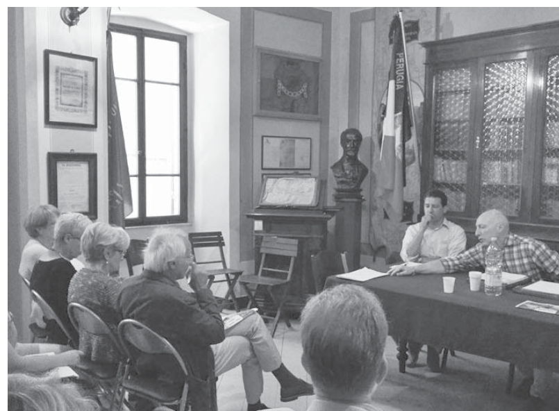
I soci fondatori della sezione di Perugia