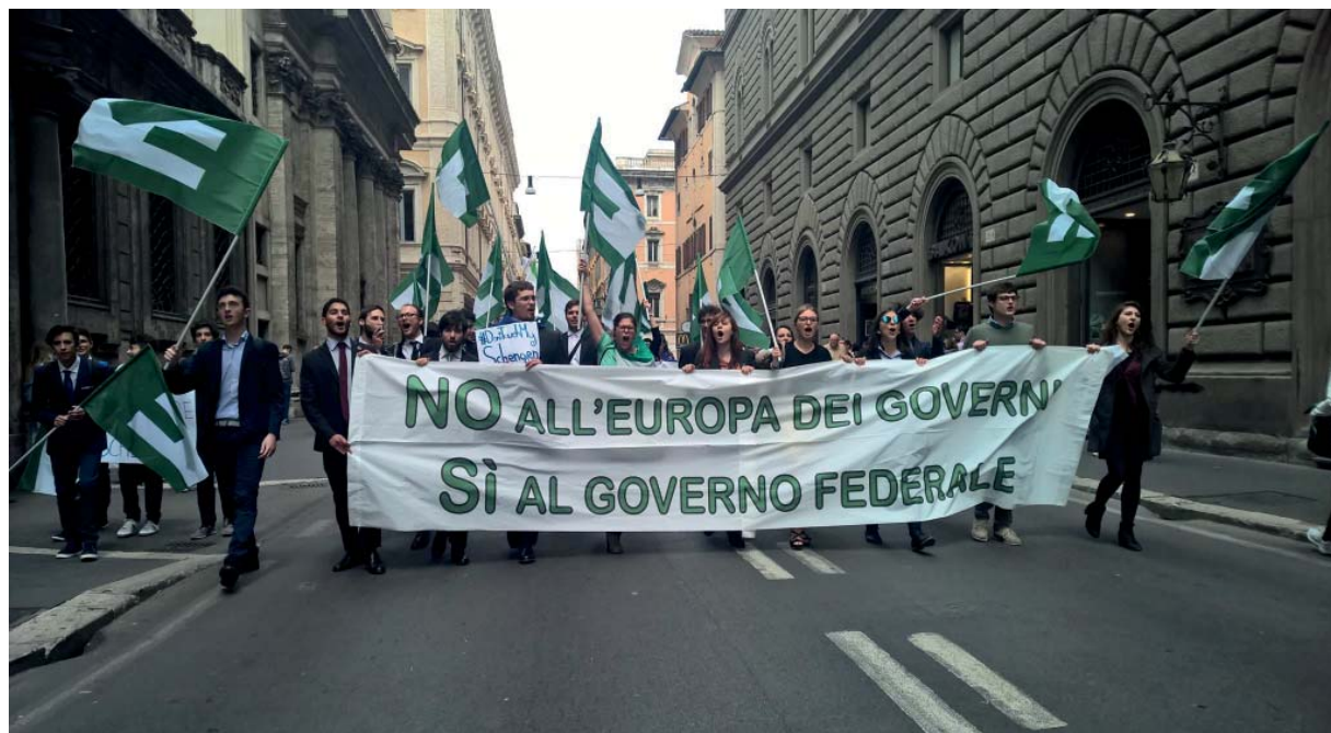
Festa dell'Europa: forte manifestazione dei giovani federalisti per le vie di Roma

[...] Ma festeggiare significa anche e soprattutto rinnovare l'impegno di tutti noi per dare nuovo slancio alla costruzione europea in una fase in cui appare messo in discussione il futuro stesso dell'Europa unita. Come non considerare minacce all'essenza dell'integrazione europea la costruzione di barriere ai nostri confini interni, che negano uno dei suoi pilastri, la libera circolazione all'interno dell'Area Schengen? Come non vedere che il progetto europeo è a rischio se in alcuni Paesi vengono violati il principio dello stato di diritto ed i diritti fondamentali, che rappresentano l'identità stessa del nostro continente? Come non rendersi conto che le ricorrenti minacce di espulsione della Grecia dall'area euro danneggiano tutti noi? Come non temere una possibile uscita di uno Stato membro - il Regno Unito - dall'Unione, per la prima volta da quando esiste l'UE? Ma da che cosa deriva la crisi profonda del progetto europeo? Deriva principalmente dal fatto che l'attuale assetto dell'Unione si sta dimostrando inadeguato rispetto a