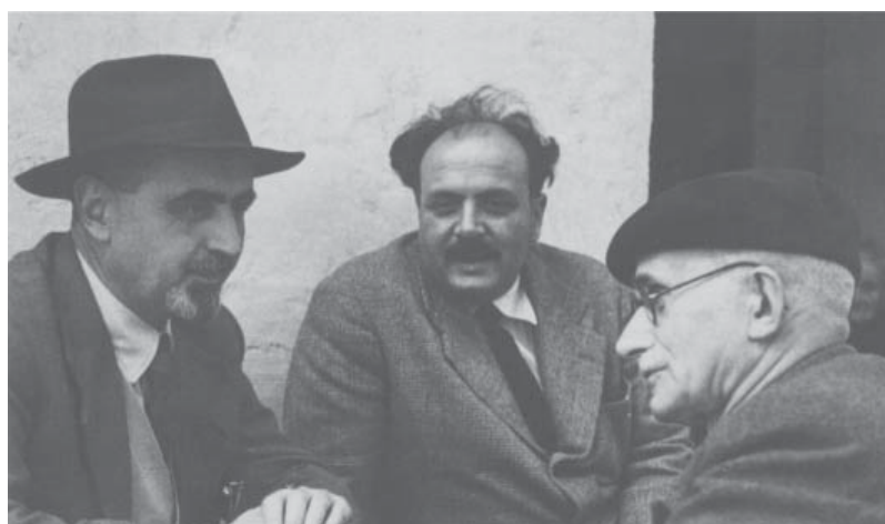
Ernesto Rossi, Altiero Spinelli e Luigi Einaudi