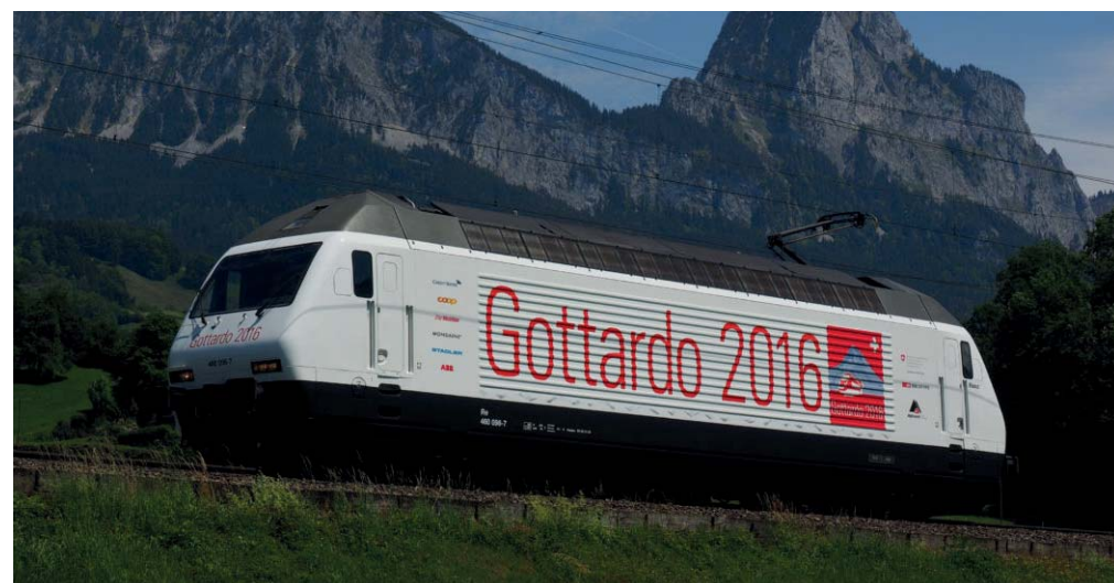
Il treno dell'inaugurazione

picarsi, perdendo tempo e allungando il percorso. La Galleria del Gottardo è stata inaugurata con una cerimonia in pompa magna cui hanno partecipato i leader di Italia, Francia, Germania e Austria, oltre che quelli svizzeri. Il primo ministro Matteo Renzi ha detto che il tunnel è il simbolo dell'Europa «che non costruisce muri ma che collega il nord e il sud, e rilancia un'economia verde con meno macchine e più rotaie». La Galleria permetterà di accelerare e rendere più intensi i collegamenti fra i Paesi europei e in questo senso è un'opera per l'unità europea. Non l'unica.