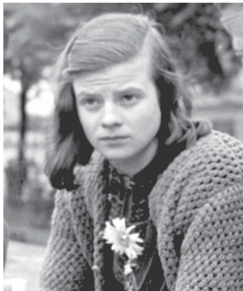
Sophie Scholl (9 maggio 1921 - 22 febbraio 1943)