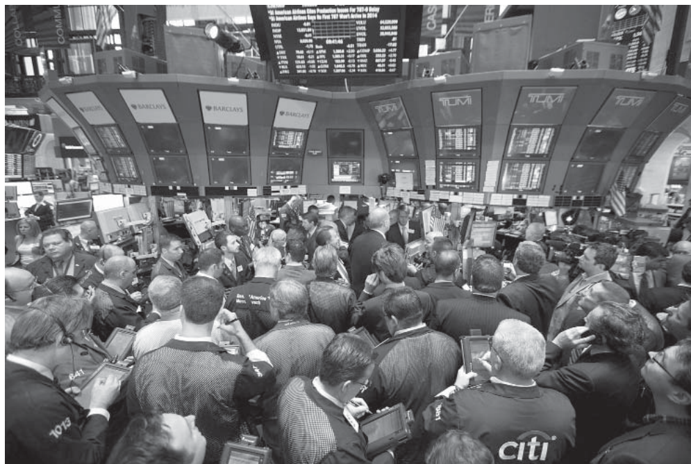
Le borse, primo termometro della crisi

Le prime reazioni dei mercati sono peggiori di quelle seguite all'11 settembre ed a Lehman Brothers. Almeno nel breve periodo per evitare il peggio i banchieri centrali, a Francoforte e a Londra, dovranno essere iperattivi. I mercati sono impazziti di fronte all'imprevedibilità di una classe politica di giocatori d'azzardo che ha utilizzato il referendum per battaglie interne ai partiti. Adesso ci sarà grande instabilità economica finché non saranno chiariti moltissimi aspetti: la separazione tra Londra e Bruxelles sarà amichevole? Quanto dureranno le trattative? Quanto peseranno le prossime elezioni britanniche? Qualcuno proverà a sovvertire l'esito del referendum? I rapporti tra Londra e le altre cancellerie europee diventeranno questioni di politica estera o Londra aderirà allo Spazio Economico Europeo? La Scozia e l'Ulster proveranno ad abbandonare il Regno Unito? Quali impatti militari e di sicurezza potrebbe avere una crisi Londra-Belfast? Gli operatori economici danno un prezzo al rischio, ma odiano l'incertezza e vorrebbero risposte a queste ed altre domande. Molti, assai sorpresi, si chiedono se le banche e le grandi imprese non avessero un piano B, visto che tanti sondaggi puntavano sul Remain , ma nessuno affermava che vi sarebbe stato un risultato schiacciante. Io credo che nessun grande operatore economi-