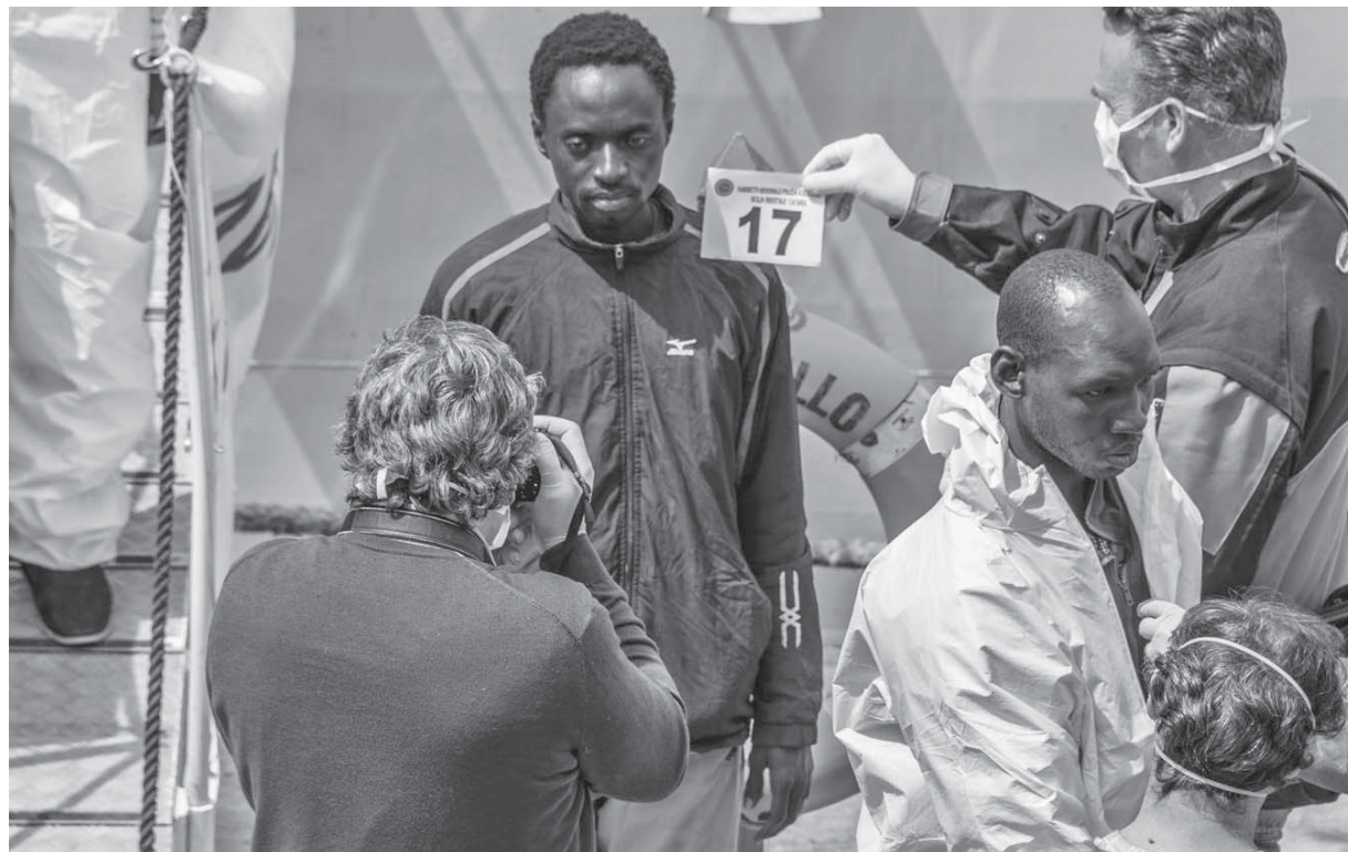
Per un controllo europeo alla frontiera esterna dell'Unione

Il grande processo migratorio verso l'Europa cui stiamo assistendo costituisce per l'UE una sfida d'importanza vitale che richiede di essere affrontato in modo unitario, almeno dai Paesi dell'Eurozona.