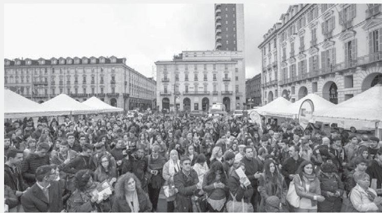
Evento in piazza per la Festa dell'Europa a Torino

Nella sede del Centro universitario, dibattito pubblico intitolato "Dopo la crisi di Schengen, quali prospettive per la sicurezza europea?".