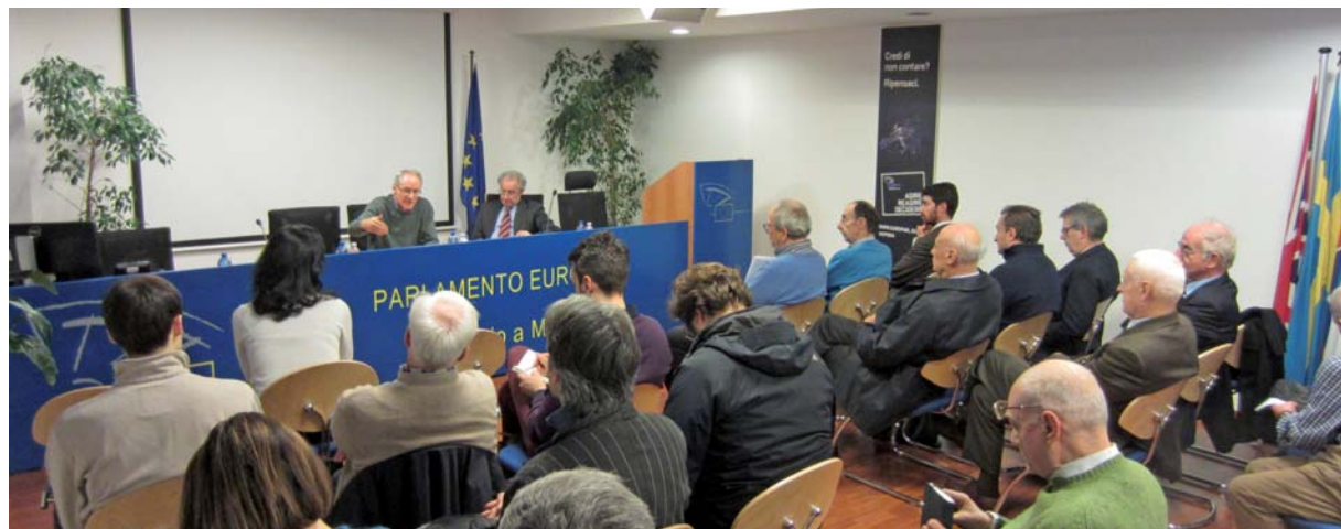
La riunione costitutiva del Comitato nella sala conferenze dell'Ufficio di Milano del Parlamento europeo

Prossimamente vi sarà una nuova riunione del Comitato per allargare la rete dei contatti ed organizzare la mobilitazione della città in vista della manifestazione di Roma.