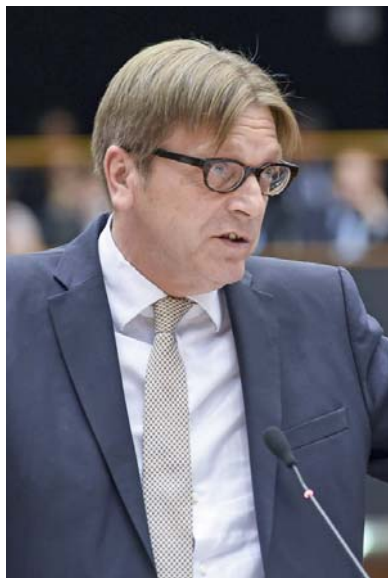
Guy Verhofstadt, presentatore del «Rapporto possibili evoluzioni della struttura istituzionale dell'Unione Europea»