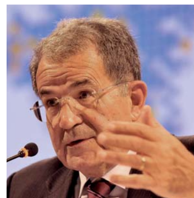
Romano Prodi espone le difficoltà dell'Unione europea

Per questo occorre che, nella paralisi intergovernativa che sta caratterizzando questa fase delle politiche dell'Unione europea, intervengano fatti nuovi, forti shock popolari pro-Europa. Le avanguardie del popolo europeo in formazione (in particolare i suoi giovani) devono mobilitarsi per chiedere non solo più Europa , cioè più politiche europee su immi-