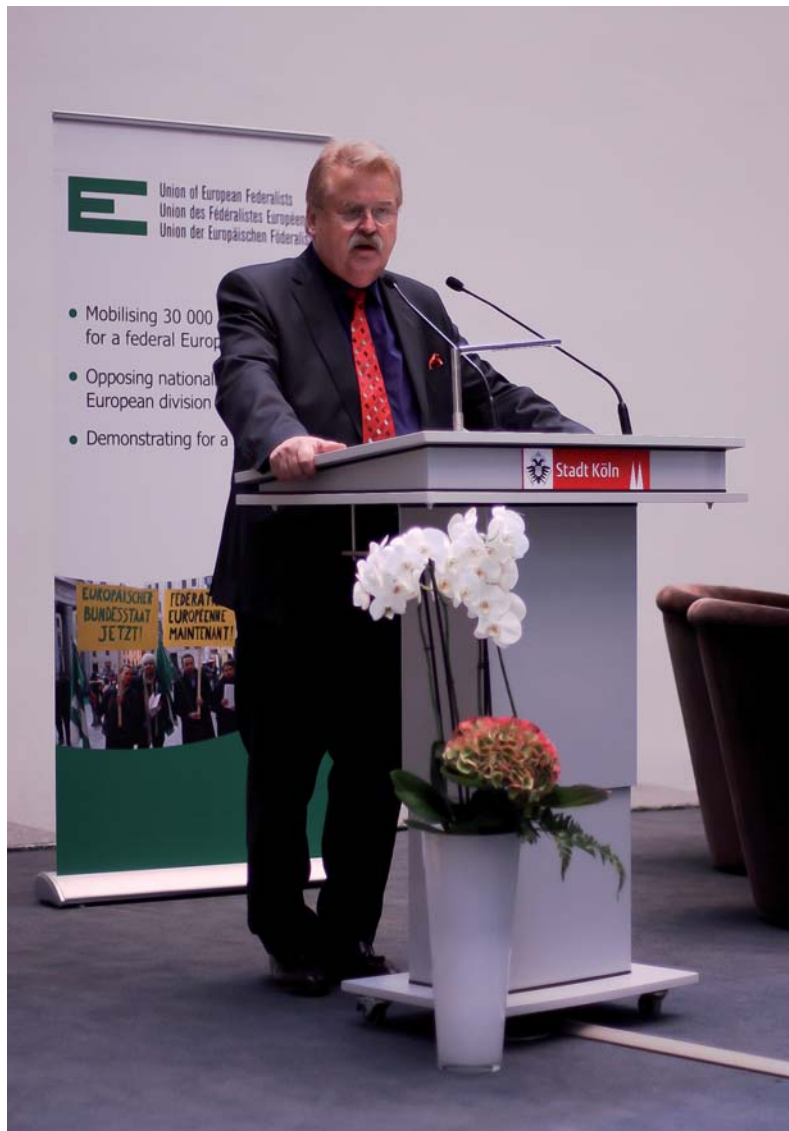
Elmar Brok, presidente dell'U.E.F., relaziona al Comitato Federale di Colonia