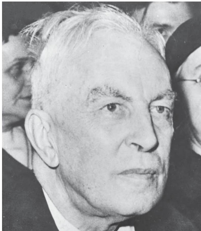
Arnold J. Toynbee – filosofo della storia, storico, politico e diplomatico inglese

Lo scopo di breve periodo della proposta è fornire un contesto in cui il Regno Unito ottenga tutto ciò che vuole: l'accesso al mercato unico senza la piena libera circolazione delle persone, l'ac-