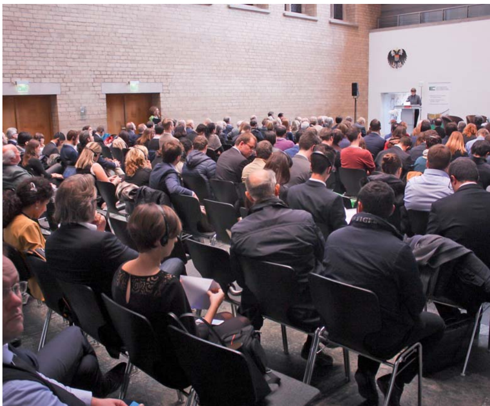
La sala del dibattito pubblico: "Europa, il nostro futuro - Come rilanciare il progetto politico europeo"

I due Comitati hanno poi ripreso separatamente i lavori in seduta plenaria. Quello dell'UEF, dopo aver approvato all'unanimità la mozione congiunta sulla manifestazione di Roma riprodotta qui sotto/a fianco , è passato alle votazioni sulle altre mozioni, sia quelle "ereditate" dal Congresso, sia su quelle elaborate dalle commissioni politiche (i testi sono disponibili in inglese, all'indirizzo www.federalists.eu/en/uef/structure/federal-committee/ ). Queste ultime hanno riguardato: l'avanzamento dell'integrazione europea (elaborata dalla prima commissione, sulla strategia e l'azione dell'UEF e riprodotta qui sotto/a fianco), il CETA e il TTIP (elaborata dalla seconda commissione, sui problemi economici), la difesa europea (elaborata dalla terza commissione) e i temi della mobilità delle persone e della migrazione (quarta commissione).