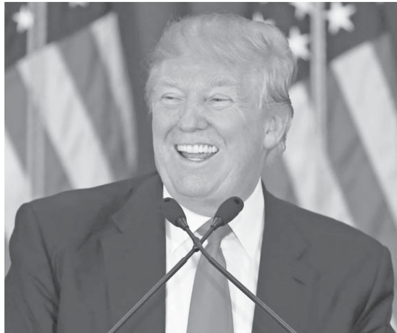
Il nuovo presidente degli USA, Donald J. Trump

Grande sorpresa mista a notevoli dosi di preoccupazione ha accolto la notizia il 5 novembre scorso che il tycoon newyorkese Donald J. Trump aveva inaspettatamente vinto le elezioni in USA. Subito dopo l'elezione, la domanda che ha attraversato il mondo intero è stata: cosa cambierà nelle scelte della politica americana, sia all'interno che all'estero? Appariva ovvio infatti, dall'esame del dibattito elettorale e dalle dichiarazioni rilasciate dal candidato Trump, che vi sarebbe stata una grande discontinuità nelle sue scelte politiche rispetto a quelle della presidenza Obama e della candidata democratica sconfitta Hillary Clinton.