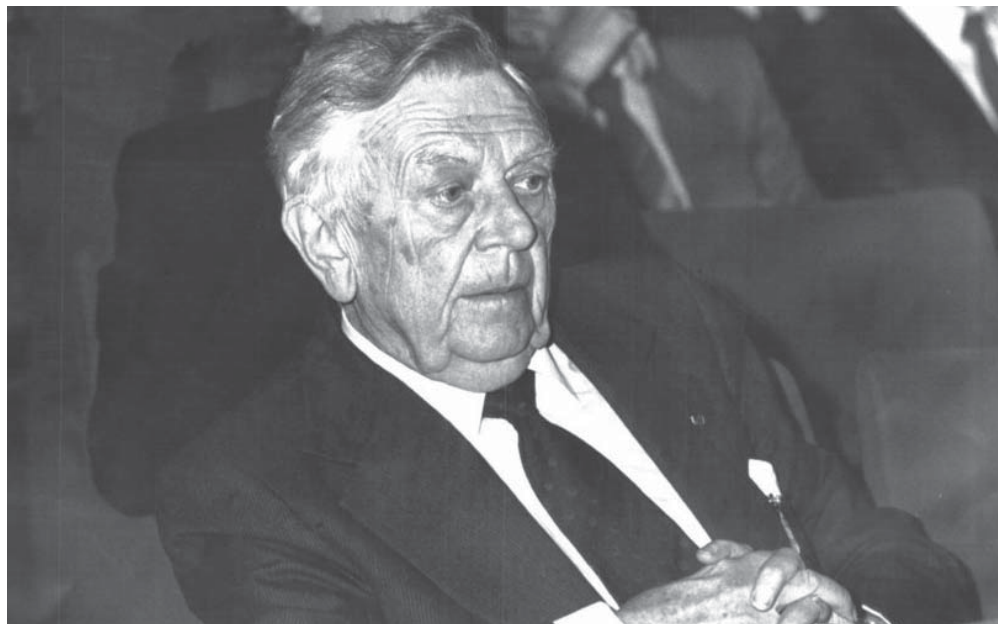
Robert Triffin, economista belga-statunitense

I pianeti che ruotavano intorno ad un unico Sole, il dollaro, si sono a poco a poco riorganizzati in sistemi più piccoli. La de-dollarizzazione dell'economia mondiale, avviata con la creazione dell'euro, procede ora a grandi passi per l'iniziativa dei BRICs, culminata nella creazione della New Development Bank e del Contingency Reserve Arrangement . La decisione del FMI, alla fine del 2015, di accogliere il renmimbi nel paniere DSP e di accrescere quote e voti dei Paesi emergenti nel FMI, con la ratifica del Congresso USA, costituisce un successo