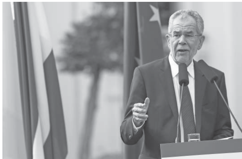
Alexander Van der Bellen, il neo-presidente dell'Austria

Non mancano anche nel nostro Paese le forze più responsabili che sanno quali incalcolabili costi avrebbe per l'Italia l'abbandono dell'ancoraggio europeo. Le elezioni presidenziali svoltesi in Austria nello stesso giorno del nostro referendum dimostrano che queste forze, se sanno ben indicare i loro obiettivi e la nefasta alternativa offerta dal populismo e dal nazionalismo, possono ancora prevalere ed anzi guadagnare maggiori consensi, com'è accaduto nel breve arco di pochi mesi nel Paese vicino.