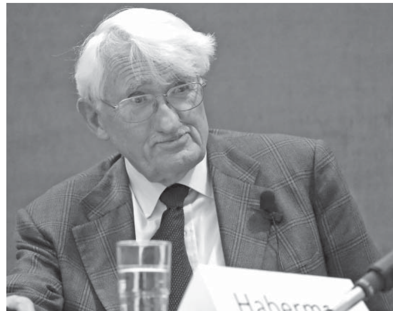
Il filosofo tedesco Jürgen Habermas

ire al Parlamento europeo poteri effettivi sia nel campo della politica economica che della politica estera. Un Parlamento senza poteri di bilancio e di governo non conta nulla agli occhi dei cittadini e dei mass media. La riforma costituzionale dovrà prevedere risorse fiscali proprie per l'Unione. Va abolito l'indecente sistema di trattative segrete tra governi per decidere quali briciole della fiscalità nazionale affidare all'Unione. Il sistema fiscale europeo deve divenire trasparente e democratico. Ad esempio, una percentuale dell'IVA, che paghiamo quando acquistiamo qualsiasi bene, deve comparire sulla ricevuta fiscale come risorsa europea (es. 90% al governo nazionale, 10% al governo europeo). Le risorse proprie devono inoltre raggiungere una dimensione minima per consentire al futuro governo europeo di varare politiche efficaci contro la disoccupazione, per la crescita sostenibile dell'economia e per la sicurezza europea. Ingenti risorse fiscali potrebbero oggi provenire da un'imposta sulle multinazionali in Europa, che sfruttano la concorrenza fiscale tra i paesi membri per pagare tasse sui profitti molto vicine allo zero per cento. L'Europa intergovernativa fa ricche le multinazionali e impoverisce i cittadini.