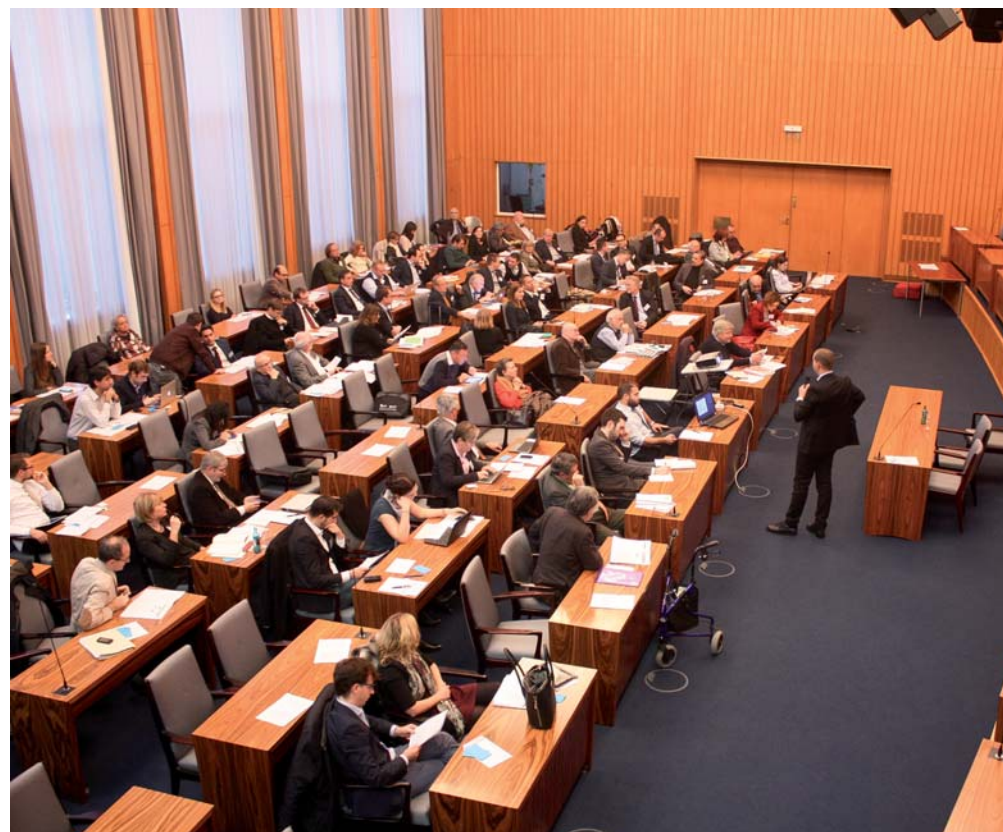
Lavori del Comitato federale a Colonia